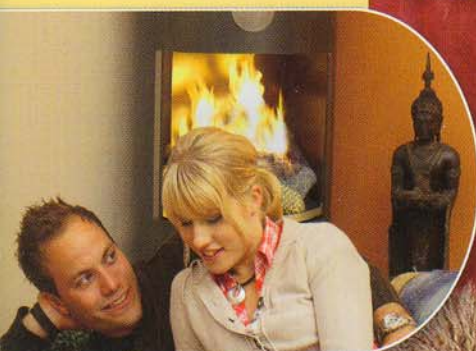
Kamine ohne Schornstein offenes & echtes Feuer Seite 36